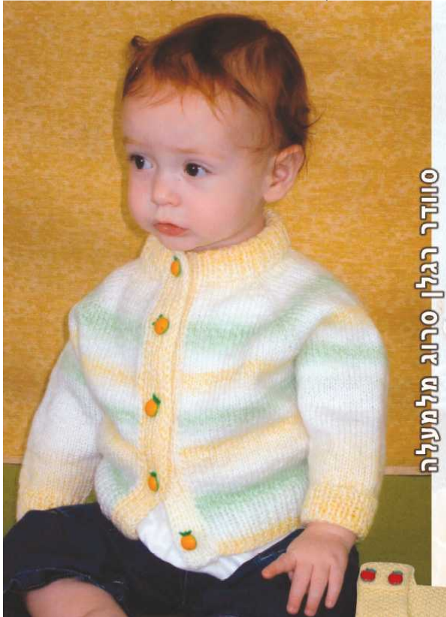
סוודר רגלן סרוג מלמעלה

עד גיל חצי שנה רעיון אדיר לאוהבות לסרוג, אך לא לחבר.